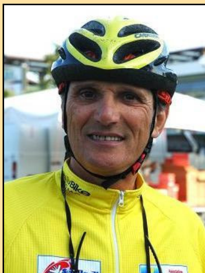
Domenico Bicocchi detto Robic Testa di Vetro